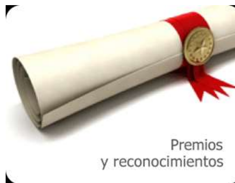
Premios y reconocimientos